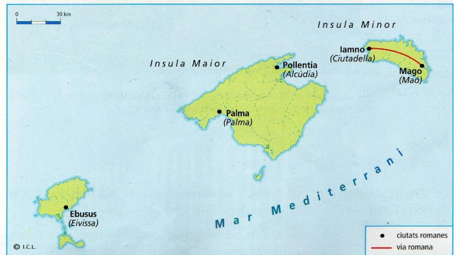
ELS ROMANS A LA NOSTRA TERRA

Les ciutats romanes eren el centre de la vida social, econòmica, política i cultural del món romà.