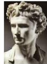
Octavio Augusto: Primer emperador